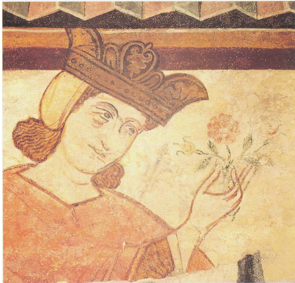
Fig. 4. Ritratto di Federico II, nell'atto di donare un fiore (Bassano del Grappa, Palazzo Finco)